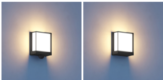
L 40 SC/ C – Closeup