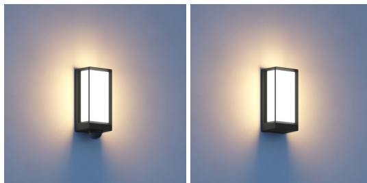
L 42 SC/ C – Closeup